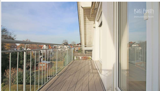
großer Balkon DG

Zimmer: 8,00 Wohnfläche ca.: 285,00 m 2 Kaufpreis: 2.990.000,00 EUR