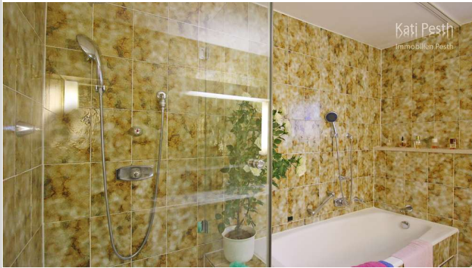
2. Badezimmer OG

Zimmer: 8,00 Wohnfläche ca.: 285,00 m 2 Kaufpreis: 2.990.000,00 EUR