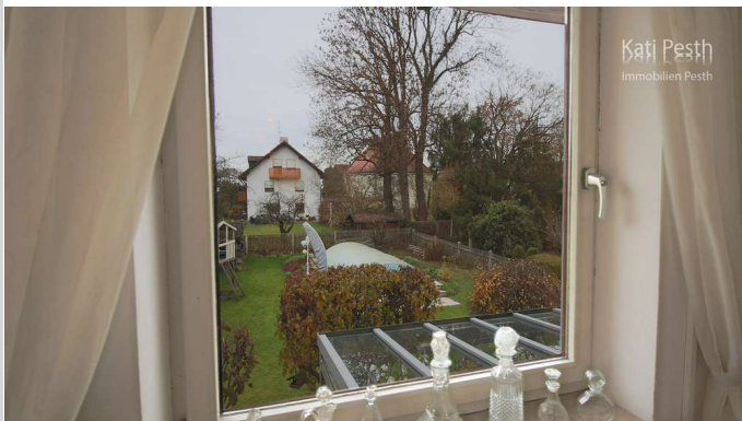
Ausblick zum Garten